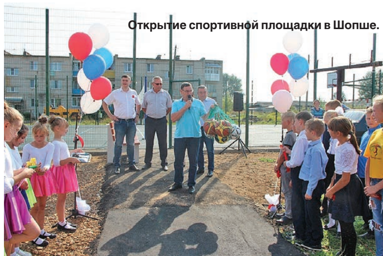
Открытие спортивной площадки в Шопше.

- Подобной площадки, пожалуй, нет ни в одном сельском поселении Ярославской области, - с гордос-