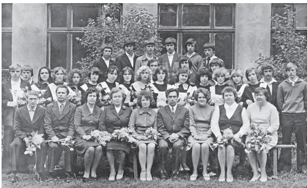
Гаврилов-Ям. Школа №2, класс 10 б 1977.