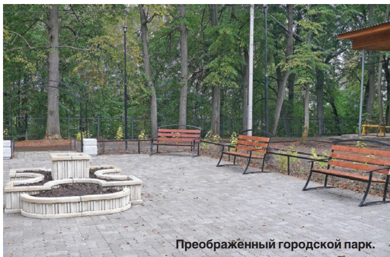
Преображенный городской парк.

Свою лепту в преображение родного двора внесли и